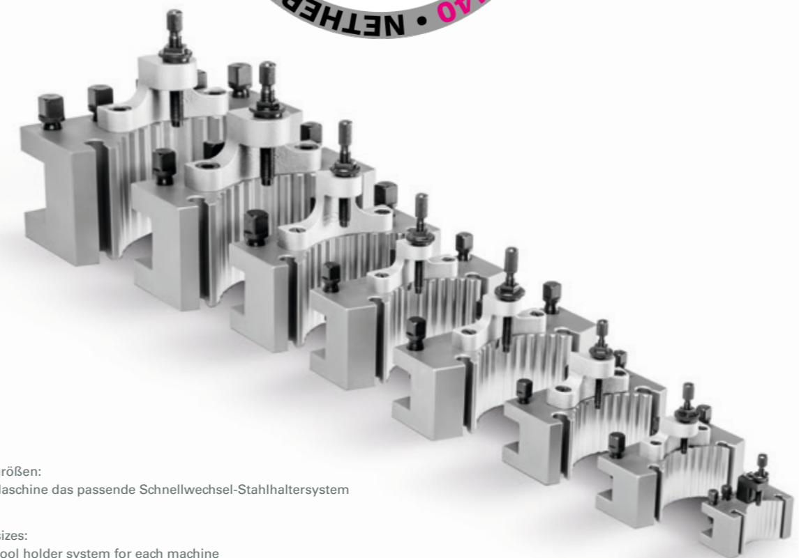
7 Systemgrößen: Für jede Maschine das passende Schnellwechsel-Stahlhaltersystem