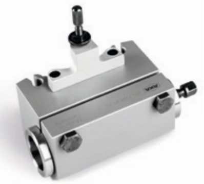
Bohrstangenhalter BS mit Morsekonushülse H für Werkzeuge mit Morsekonusschaft